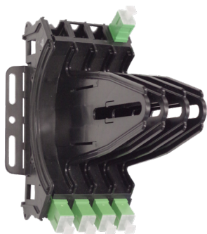
Ensamblaje de base vacío para Drop Wheel