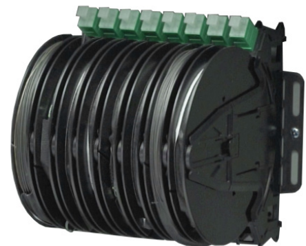
Ensamblaje de Drop Wheel cargado de FieldShield